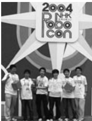
NHK大学ロボコン2004準優勝

フォーミュラプロジェクトでは、全日本学生フォーミュラ大会に参加するために学生有志が立ち上げた岡山大学フォーミュラプロジェクト ( http://powerlab.mech.okayama-u.ac.jp/~oufp/ ) を支援しています。全日本学生フォーミュラ大会とは、社団法人自動車技術会が平成15年に設立したもので、排気量610cc以下の