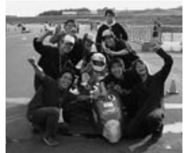
全日本フォーミュラ大会エントリーカー

す。第1回大会は参加校17校であったものが、今年度の第3回大会では45校がエントリーしており、年々参加校が増加しています。第2回大会までは、中国・四国地方ならびに九州地方からのエントリーはありませんでしたが、本年度は我々岡山大学も含め、中国・四国地方から3校、九州地方から1校のエントリーがあります。今年度第3回大会は、9月6～9日に富士スピードウェイで開催されました(参照Webサイト http://www.jsae.or.jp/formula/ )。この同窓会報が出版される頃には、結果がWebサイトでも公開されていることと思います。岡山大学フォーミュラプロジェクトでは、現3年生が中心に平成16年11月ごろから活動を行っています。現在は、学部1年生から3年生までが集まっており、計12人で活動しております。今年度はとにかく第3回大会への出場を目指し、「車体製作の基礎を学ぶ」を方針に活動しています。